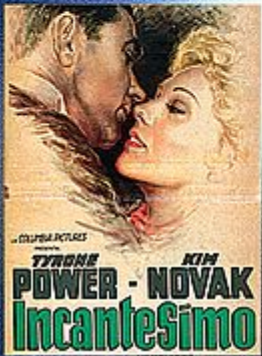
Tyrone Power e Kim Novak in "Incantesimo" (1956) e, a destra, Rodolfo Valentino e Agnes Ayres nel "Figlio dello sceicco" (1926)

www.quotidiano.net/caffè caffè@quotidiano.net